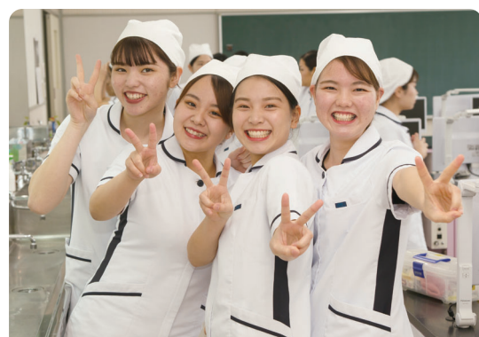
沖縄歯科衛生士学校