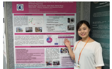
アジア歯科麻酔学会

どんな歯科衛生士になれるか、自分の可能性を広げるきっかけの種をぜひこの瞬間からたくさんまき続けてみてください。私は学生時代に口腔外科に興味があり、一般診療所勤務を経てから総合病院の口腔外科勤務に移りました。そこでの仲間や患者さんとの出会いで得たさまざまな思いと経験から全身管理の重要性を実感し、全身疾患や障がい者対応についてより専門的に勉強・経験できる環境を求め現在の職場へとたどり着きました。現在までに障がい者歯科と歯科麻酔、2つの分野の認定資格の取得をし、さらに海外留学がきっかけとなり国内だけではなく海外での学会発表や海外ボランティアの参加と可能性が広がりました。それぞれの環境での経験や出会った人たちの言葉や姿勢、そこで得た感情それらは可能性を広げるきっかけとなり原動力となります。皆さんも、興味のあるものはぜひ自分の目で見て経験し、そこで得た感情を大切にしてみてください。無駄なことは何一つなく、将来、歯科衛生士となってからも必ず生かされます。専門性と豊かな人間力で魅力溢れる歯科衛生士になってくださいね!