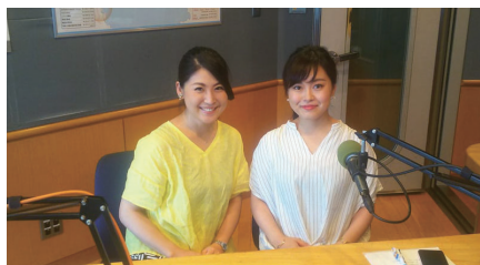
FMヨコハマラジオ出演

あなたはどんな歯科衛生士になりたいですか？ 現在、歯科衛生士は専門性を生かせる環境やチャンスが増え、認定資格の取得など自分自身の行動次第では活躍できる場がどんどん広がっていきます。