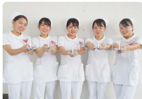
神奈川歯科大学短期大学部