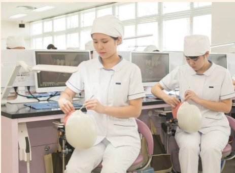
臨床シミュレーションシステムでの実習

本校は1975年開校、45年の歴史と伝統のある学校です。 在学中に豊富な知識と高い技術、そして優しさと感性を持ち 備え、歯科医療を支える歯科衛生士を育成しています。