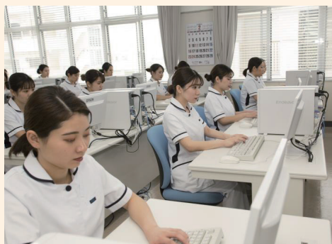
パソコンを使用しての講義