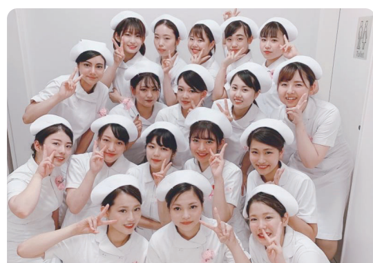
中部ビューティ・デザイン・デンタルカレッジ

日本は今や世界で2番目に就業歯科衛生士数が多い国となりました。その90%以上が歯科診療所に勤務しています。近年、診療所の受診者の45%以上は65歳以上の高齢者となり、全身管理や医科歯科連携が重要となっております。また、地域包括ケアシステムの構築が急がれる中、歯科衛生士も診療所から地域に出て多職種と連携しながら専門性を発揮することが求められています。これらの期待に応えるためには、学生時代の基礎学習をベースに卒後の臨床実践力を高める生涯研修が重要であり、自らの専門性を深め確かなものにする事です。歯科衛生士会は、新人歯科衛生士のデビューから復帰まで応援しています。皆様が実践力を高める学びを通して歯科衛生士業務の素晴らしさを早期に実感されることを願っております。