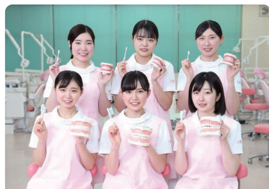
青森歯科医療専門学校