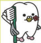
広島県歯科医師会 イメージキャラクター 「はっぼくん」

広島高等歯科衛生士専門学校は、昭和 32 年歯科衛生士養成所として設立され、長い歴史と伝統にあふれる学校です！！ 平成 29 年 1 月、広島県歯科医師会館の新築移転に伴い、その 3、4 階へ移転しました。よりスキルの高い、また一人の人間としても魅力ある歯科衛生士を育成しています。 学生は新校舎で気分一新、笑顔を守るスペシャリストを目指して学校生活を送っています。