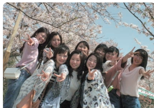
広島高等歯科衛生士専門学校