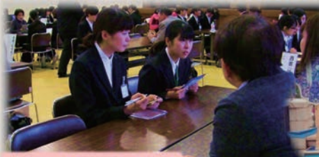
歯科医院との就職面談会