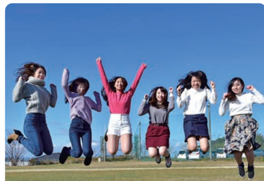
伊勢保健衛生専門学校