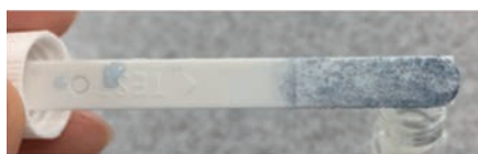
デントカルト®LBにて細菌培養の様子

以上に加えて、普段の歯みがき習慣や市販歯磨剤の選択基準などに関する自記式質問調査票による調査と、口腔診査も行いました。