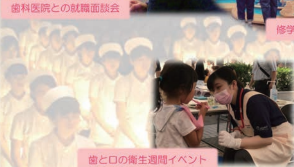
歯と口の衛生週間イベント