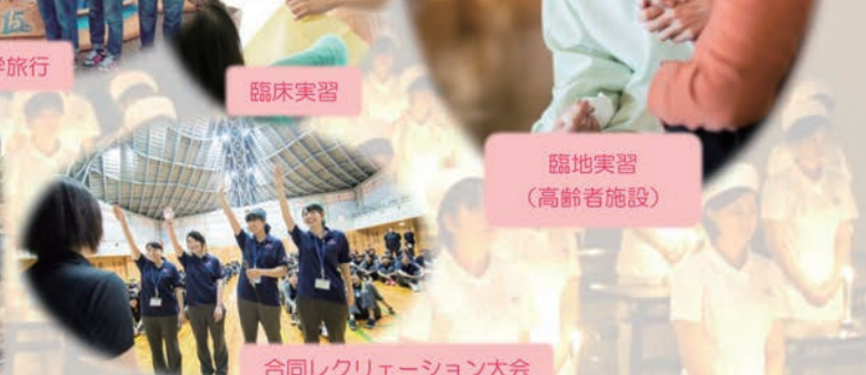
合同レクリエーション大会