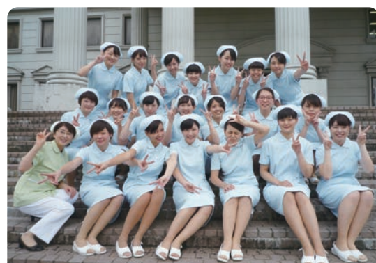
東北歯科専門学校