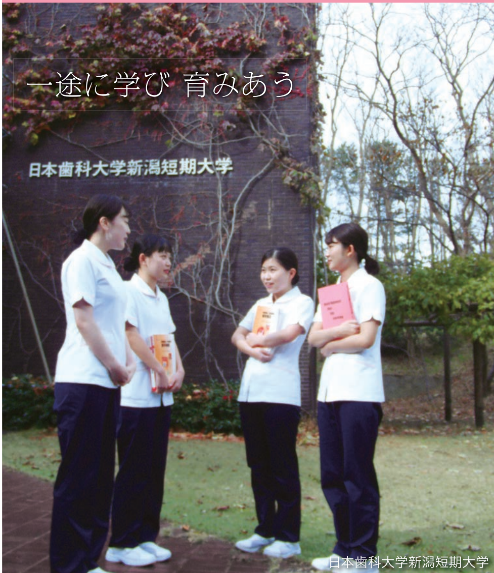
日本歯科大学新潟短期大学