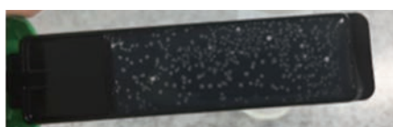
デントカルト®SMにて細菌培養の様子

【方法】 歯みがき前・歯みがき直後・歯みがきから1時間後・歯みがきから2時間後の計4回、細菌カウンタ(パナソニックヘルスケア)を用いて口腔内細菌数を計測しました。また歯みがき前・歯みがきから2時間後の計2回においては、加えてデントカルト®SMおよびデントカルト®LB(オーラルケア)を用いて、唾液中の Streptococcus mutans 菌数と Lactobacillus 菌数も計測しました。同一対象者に対して殺菌成分含有市販歯磨剤を使用した場合を使用群、使用していない場合を不使用群として分析を行いました。歯磨剤はピュオーラクリーンミント(花王)を使用し、歯みがきには滅菌済みの歯ブラシを使用していただきました。