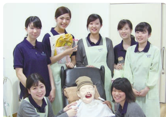
長崎歯科衛生士専門学校