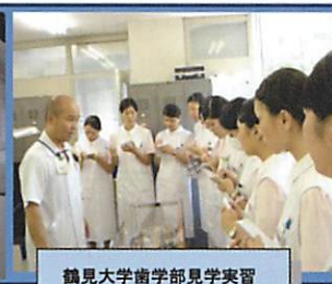
鶴見大学歯学部見学実習