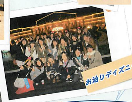
お泊りディズニー

4年制大学として開学し5年目となる本学は、一般教養から専門知識やスキルまで、幅広く学ぶことができます。また専門職間の連携を学ぶため、学科を超えて看護・栄養・リハビリテーション学科との合同授業も行われています。