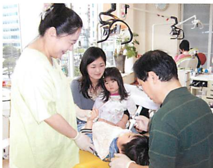
お母さんも2歳から定期健診で来院しています