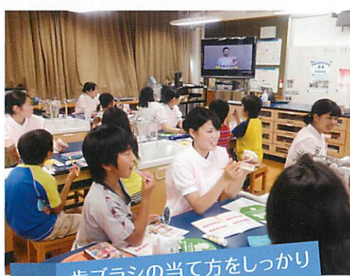
歯ブラシの当て方をしっかり覚えてね。