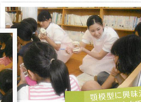
顎模型に興味津々の小学生たちです。