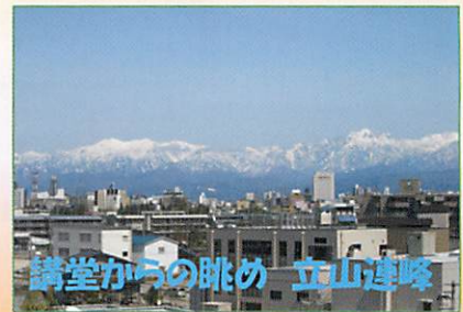
講堂からの眺め 立山連峰

富山歯科総合学院は昭和48年に開校し、現在41・40・39期生が在籍しています。 近辺には大学や高校、スポーツ公園等がある勉学に適した環境に立地しています。 本校は「広い視野を持った豊かな人間形成」を理念とし、3年間を通して学生と教員が共に悩み共に成長をしたいと考え取り組んでいます。 人間形成を育むカリキュラムとして「国語」「美術」「音楽療法」「保健体育」「英会話」などを組み入れています。 3年生時に「臨地・臨床実習報告会」を開催しています。 研究テーマを考え、実習先の指導教員から指導をいただきながら素材集めと構築をしていきます。その後「プレゼン技術」と「医療情報処理」の授業の中で仕上げます。 この過程の中で大きく成長し、「プロフェッショナル」へ歩み始めていると感じています。