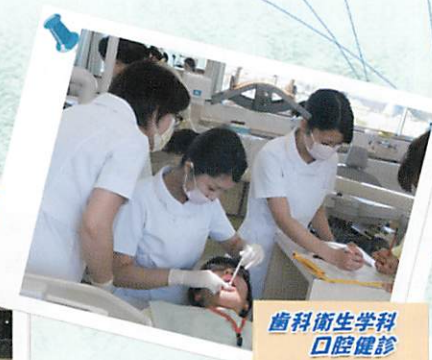
歯科衛生学科 口腔健診