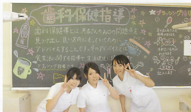
富山歯科総合学院歯科衛生士科