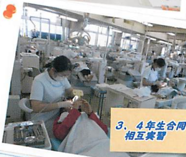
3、4年生合同 相互実習