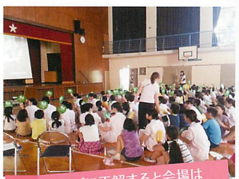
クイズに正解すると会場は大いに盛り上がりました。