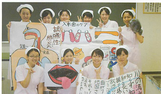
中央歯科衛生士調理製菓専門学校