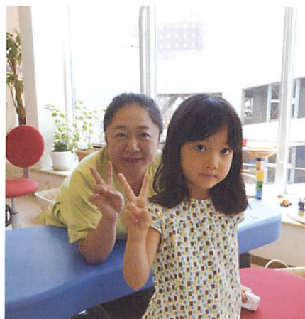
むし歯がなくてひと安心

当院に来院した子は、みんな楽しそうに帰っていくと言われたことがあります。この子どもたちの笑顔に元気のパワーをもらい、私たちもハッピーになります。もちろん、2歳までは泣く子がほとんどですが、定期的に来院している子は3歳頃からは泣かなくなります。泣かなくなったと思ったら、あっという間に小学校に入学し、そして大学生へと成長します。こんなに変化のある時期に、子どもたちの成長過程を見守ることができる、定期健診は毎回楽しみです。最近は、子どもたちの中から歯科医師や歯科衛生士になる人が出てきています。私たちを見て、やりがいのある仕事と感じてくれているのだと嬉しく思っています。