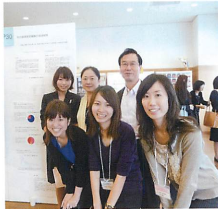
スタッフ全員で小児歯科学会に参加