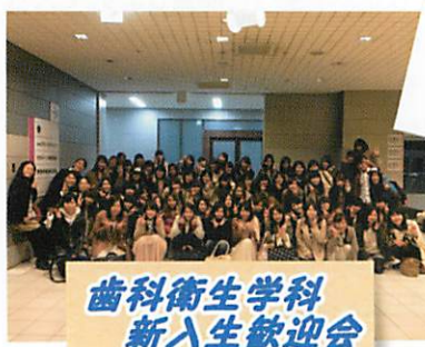
歯科衛生学科 新入生歓迎会