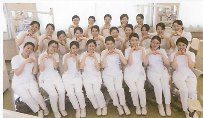
千葉県立保健医療大学