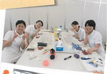
ホワイトニング実習