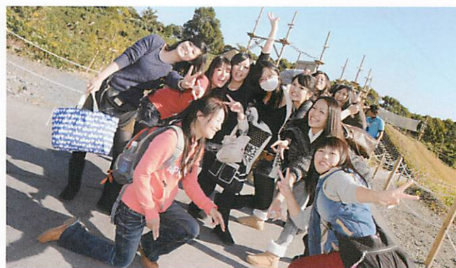
太成学院大学歯科衛生専門学校