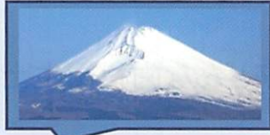
校舎から富士山が見えます！

本校は、富士山の麓、静岡県東部地区では唯一の歯科衛生士科です。 歯科衛生士科と調理経営学科からなる専門学校です。 調理経営学科の先生からは、介護食やかむかむクッキングなど学んでいます。 また、学内実習では実習専門の講師も加わり、少人数制の教育を行っています。 三年間を通して様々な行事を体験しながら、歯科衛生士になるために日々頑張っています。