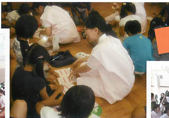
歯ぐきのチェックをしてみよう!