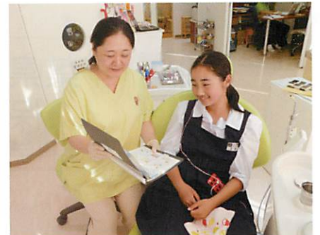
中学生に保健指導

歯科衛生士養成校の実習施設でもある当院では、学生さんから就職の相談を受けます。その時は、「就職して3年間は同じ所で頑張る」とアドバイスしています。すなわち、「1年目は仕事の内容を覚える」、「2年目は言われたことができる」、「3年目にしてやっと先輩の力を借りずに仕事ができる」一人前の歯科衛生士になれると思うからです。自分に合った就職先を選ぶためにも、時間のある学生時代に色々な経験をして視野を広めることが大切です。歯科医院でアルバイトしたり、ボランティアに参加したりして、様々な所で働く歯科衛生士に出会って現場の話を聞き、将来の自分に役立ててください。