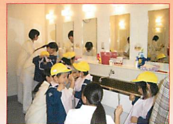
幼児歯科衛生教育実習