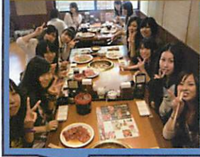
全学年合同球技大会・食事会

本校は、富士山の麓、静岡県東部地区では唯一の歯科衛生士科です。 歯科衛生士科と調理経営学科からなる専門学校です。 調理経営学科の先生からは、介護食やかむかむクッキングなど学んでいます。 また、学内実習では実習専門の講師も加わり、少人数制の教育を行っています。 三年間を通して様々な行事を体験しながら、歯科衛生士になるために日々頑張っています。