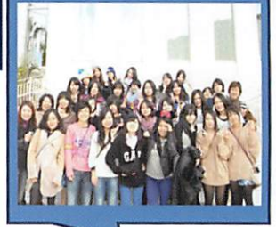
海外・国内研修旅行