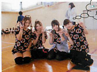
二科合同 球技大会