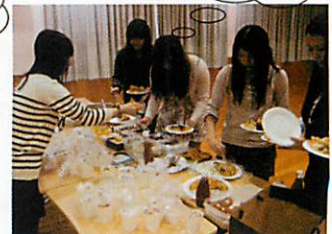
ポットラック パーティー