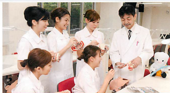
九州看護福祉大学 看護福祉学部口腔保健学科