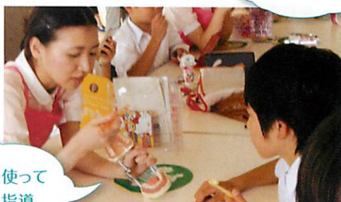
顎模型を使って歯みがき指導