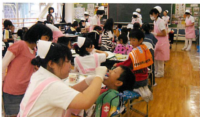
葵メディカルアカデミー 歯科衛生科