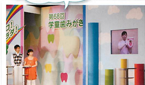
国技館のスタジオの様子