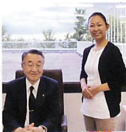
理事長先生と。後ろは海、スカイツリーも見えます。

また、治療の基本であるブラッシング指導には十分に時間をとります。そして患者様自身に気づいていただき、目に見えて口腔内の状態が改善されていくことが、なにより私の喜びです。歯や歯肉だけを診るのではなく、患者様の心や健康にも寄り添い、「ここに来て良かった! また会いに来ますね。」と言ってもらえるよう、日々勉強、経験を重ねていきたいと考えています。患者様とお話をする時に、より深くコミュニケーションがとれるよう、毎朝新聞を読むようにしています。また現在の流行を知るために、通勤時間