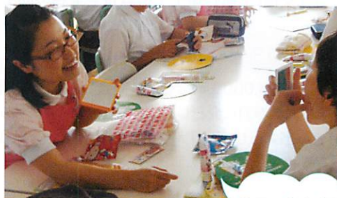
お口の中を確認中

スタジオからの呼びかけに子供たちが元気に対応し、その様子が全国や海外の学校と繋がる双方向ならではのライブ体験に、会場が盛り上がりました。歯科衛生士養成校の学生たちは、オープニング時はやや緊張した面持ちで児童と接していましたが、講話が始まると、顎模型を使って口の説明をしたり、一人ひとりの口の状態を確認しながら歯みがき指導をしていました。大会終了後は、名残惜しそうに手を振って児童を見送っていました。