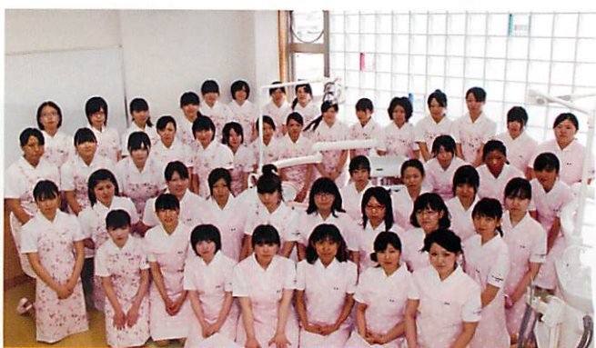
オホーツク社会福祉専門学校 歯科衛生士科

歯科衛生士は、口腔保健の専門職として、人々が生涯にわたり口腔機能を健全に維持し、口腔衛生状態が良好に保たれるよう、診療室や地域において、プロフェッショナル・ケアとセルフケア支援の役割を果たすことが求められています。歯科衛生士の業務には、歯科予防処置・歯科診療の補助による「歯科医療行為」があり、また、健康教育、健康相談、訪問指導等による「歯科保健指導」があります。そして、歯科医療行為においては高い知識と技術力、歯科保健指導においては様々な状態に対応して相手のモチベーションや行動変容を引き出すコミュニケーションの力が必要です。つまり、科学的・論理的な思考と人の心を思う感性に支えられた人間力の勝負なのです。地域の人々や患者さんにとって頼りがいのある歯科衛生士となるために、常に学ぶ姿勢と態度が大切です。