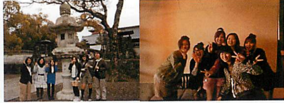
蓮華院誕生寺、玉名歴史博物館・・・ 学外研修を通して、大学のある玉名市について学びます。