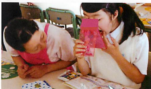
第二大臼歯を確認してみよう