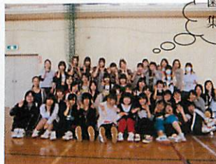
歯科衛生科 集合写真