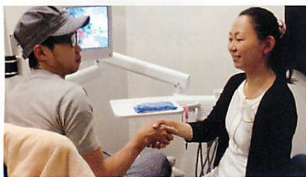
患者様とは握手でお別れ...また会える日まで!

本院の船木歯科診療所と連携を取りインプラントメンテナンス、ペリオ治療、定期健診、エステティックなクリーニングと業務内容は幅広く、口腔機能向上、う蝕、歯周病予防を考えた診療に取り組んでいます。