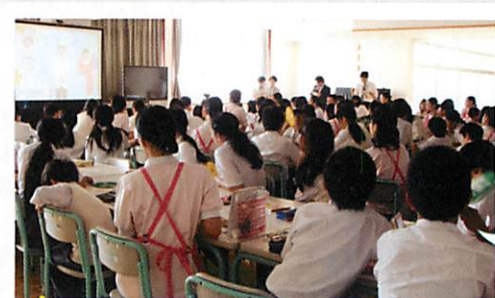
歯の衛生講話を真剣に聴いています