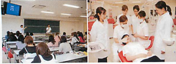
歯科領域だけでなく医療、保健、福祉領域の豊富な教育資源があります。