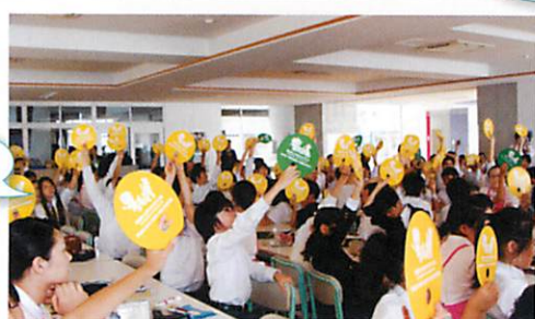
歯のクイズに挑戦