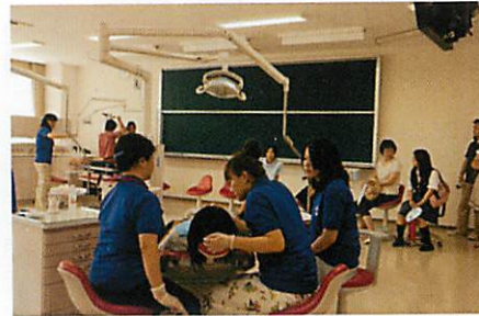
オープンキャンパスの風景