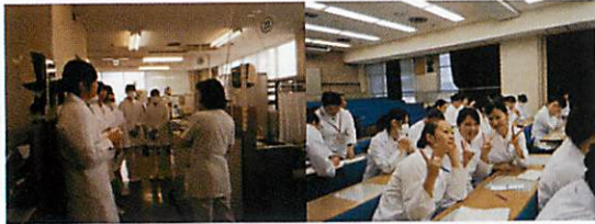
口腔保健臨床実習Ⅰ（鹿児島大学見学実習）