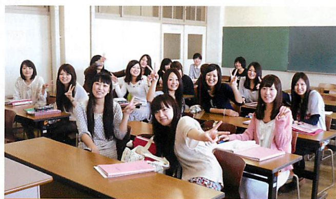
神戸常盤大学 短期大学部 口腔保健学科