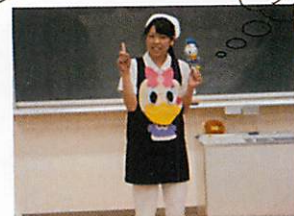
エプロン シアター