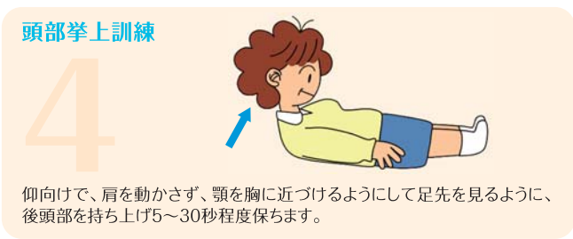
イラスト:河野八恵(福岡県歯科衛生士会会員)

上記で紹介した口腔機能の訓練方法はほんの一部です。歯科医院では、検査を行い、その方の口腔機能に合わせて、メニューが提案されます。詳しくは、かかりつけの歯科医院にご相談ください。