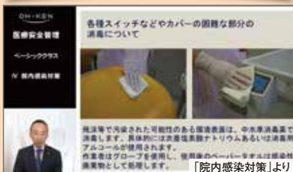
「院内感染対策」より

医療事故や院内感染を防ぐために。患者さんと歯科医療従事者と医院の未来を守る、医療安全対策の考え方や実践法をイチから学べます。