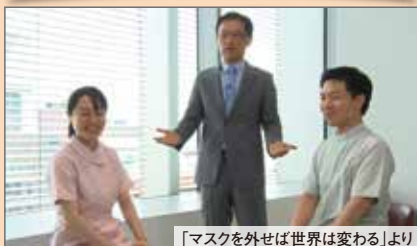
「マスクを外せば世界は変わる」より

書籍だけでは理解が難しい“医療面接の勘どころ”を、ロールプレイングとフィードバックをとおして楽しみながら学べます。