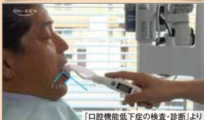
「口腔機能低下症の検査・診断」より

口腔機能低下症の基礎知識や検査手順を動画で学び、臨床における口腔機能維持・改善の実践力を高めましょう(日本老年歯科医学会監修)。