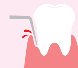
歯ぐきの出血を調べる検査