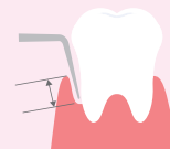
歯周ポケットの深さを調べる検査