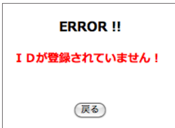
↑論文投稿システム 認証エラー画面 (登録IDが間違っている場合)