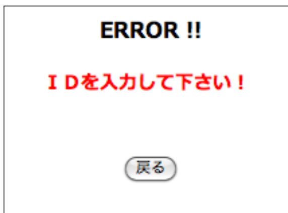
↑論文投稿システム 認証エラー画面 (ID未入力の場合)

万が一、登録したIDとパスワードを忘れてしまった場合は、もう一度利用登録からやり直してください。